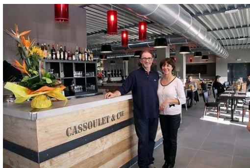
Restaurant "Chez Marty" (120 couverts). Ouverture en Novembre 2011.

Choisi par le groupe Leclerc pour l'implantation de son usine de conditionnement de produits de la mer - Scafish - et de sa centrale d'achat Sud, la Socamil.